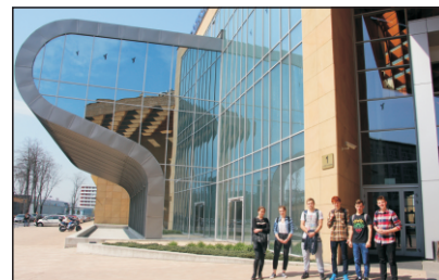
Współpraca - Uniwersytet Rzeszowski

Współpracujemy z Uniwersytetem Jagiellońskim, Uniwersytetem Rzeszowskim, Wyższą Szkołą Prawa i Administracji w Rzeszowie, Wyższą Szkołą Informatyki i Zarządzania w Rzeszowie, Państwową Wyższą Szkołą Zawodową w Krośnie i Sanoku, Młodzieżowym Obserwatorium Astronomicznym w Niepołomicach.