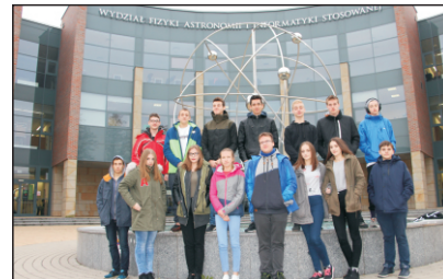
Współpraca - UJ w Krakowie